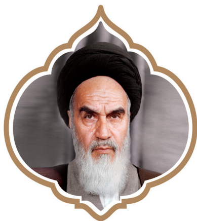
حضرت امام خمینی (رحمه الله علیه)