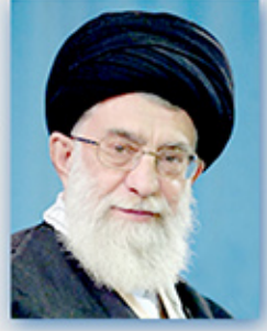
امام خامنه‌ای (حفظه...):

مادر جنگ ابهت دوا بر قدرت شرق و غرب را شکستیم. مادر جنگ به مردم جهان و خصوصاً مردم منطقه نشان دادیم که علیه تمامی قدرتها و ابر قدرتها سالیان سال می توان مبارزه کرد.