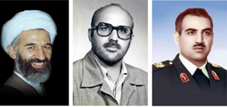
شهید شهادت محوری: شهید شهادت محوری، شهید شهادت محوری، شهید شهادت محوری