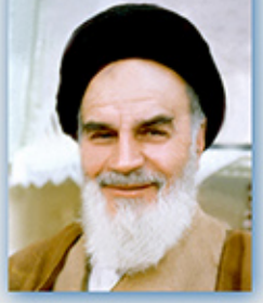
امام خمینی (ره):

خبرنامه نهضت فرهنگی و تربیتی راهیان نور جنوب اسفندماه ۱۳۹۲