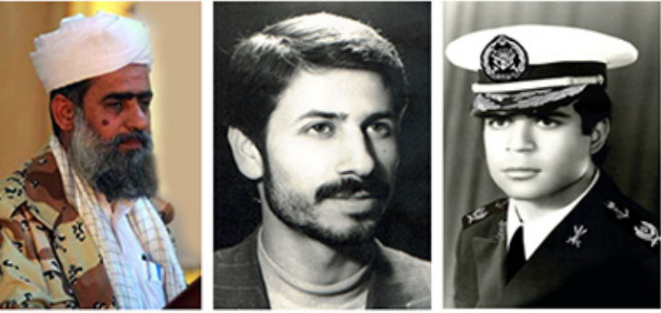
شهید در یادار: شهید در یادار، شهید در یادار، شهید در یادار