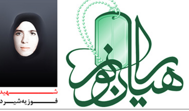
شهید فوزه شیردل