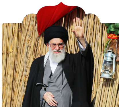
این حرکت راهیان نور را مغتنم بشمارید

بزرگترین درس دفاع مقدس این بود که نشان داد، یک ملت در سایه اتحاد، ایمان و حسن ظن به خداوند متعال و اعتقاد به صق وعده الهی، می تواند از همه گنرگاه های دشوار عبور و با ایستادگی در مقابل دشمن، او را وادار به عقب نشینی و شکست کند